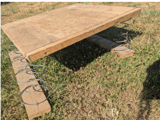
planche a palet sur ressort

Le premier joueur lance un palet plus petit, appelé le maître, sur la planche en bois. Le but du jeu pour les deux adversaires est de s'approcher le plus possible du maître, sans tomber hors du carré. Un jeu d'adresse où vous risquez de vous casser les dents.