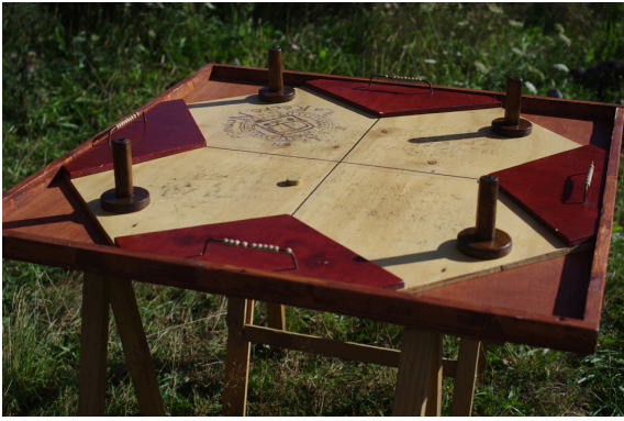
Table à glisser *4

Défendez votre camp du palet à l'aide de votre poignée. Un jeu indispensable pour les professionnels du jeu et de l'animation.