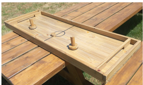
Table à glisser 2 joueurs

Jeu de la meule dimensions: 1.40m x 20cm x 15cm Lancez la roue sur la zone de départ pour la faire rouler le plus loin possible sans dépasser la zone 100.