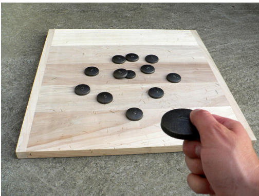
Planche a palet

2 jeux de flippers en bois, un solo sur le thème de l'espace et un duo sur le thème du foot. attention aux obstacles!